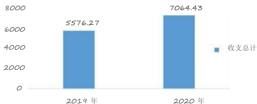
2019-2020 年收支总计对比情况（图 1）

本部门 2020 年度收、支总计（含结转和结余）7064.43 万元。与 2019 年度决算相比，收支各增加 1488.16 万元，增长 15%，主要原因是增加了两个养老项目。 2019-2020 年收支总计对比情况（图 1）。